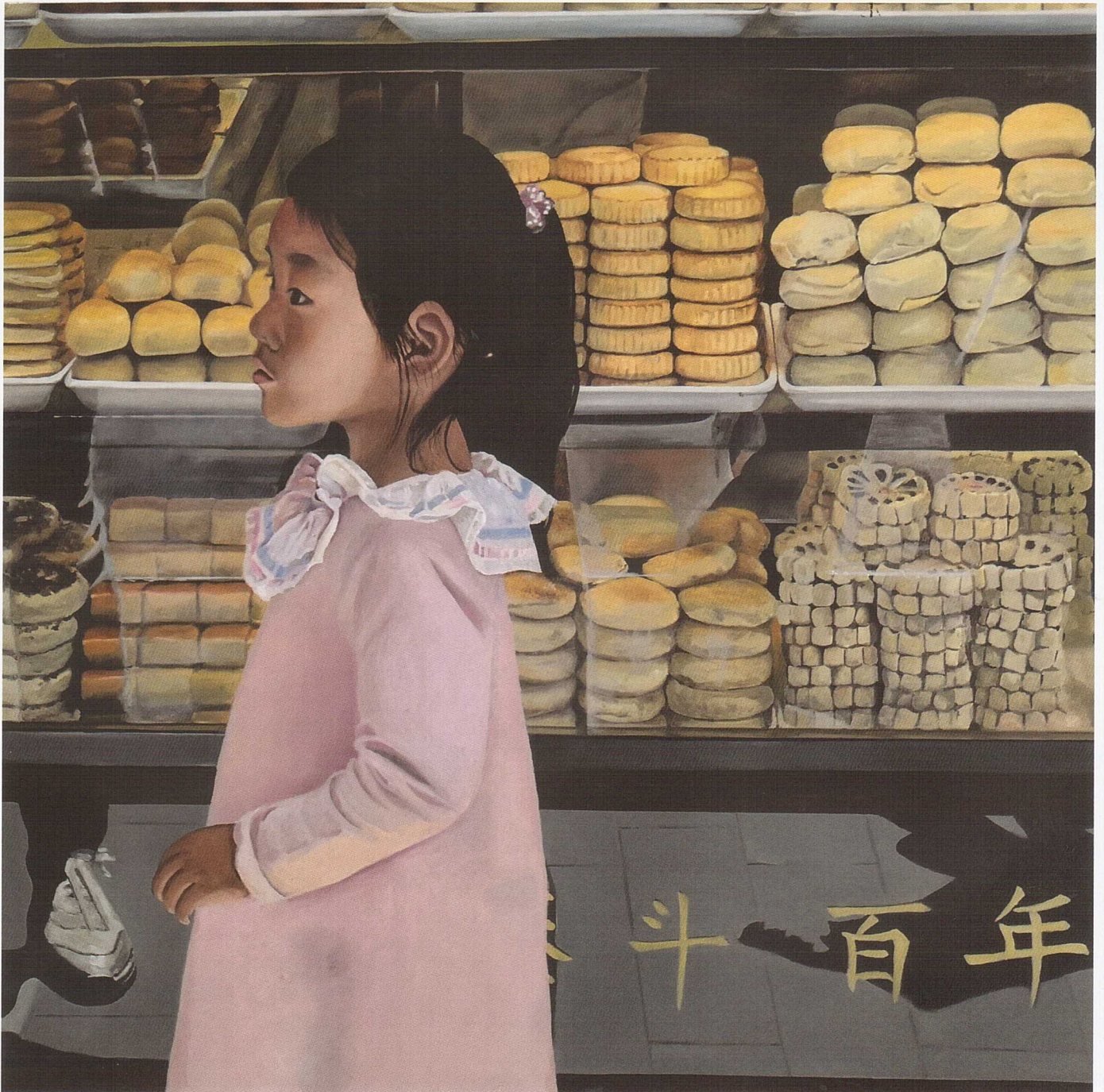
Anke Rohde; Shanghai Cake Shop; 2019, Öl auf Leinwand, 60 cm x 60 cm, Foto: Anke Rohde, Wiesbaden © Anke Rohde

Messeschau vom 10. bis 12. September 2021 im RheinMain CongressCenter Wiesbaden